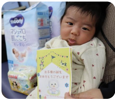
▲モデルになってくれた赤ちゃん

今回は、イメージモデルとして、市民の方にご協力いただき、写真を撮らせていただきました。