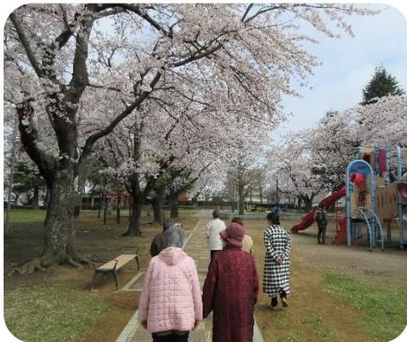
「中央公園でお花見」