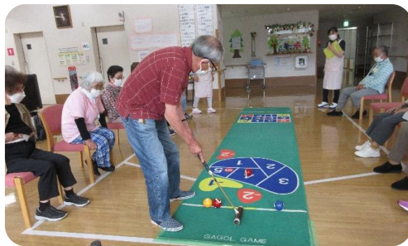
[ゲーゴルゲームで大盛り上がり]