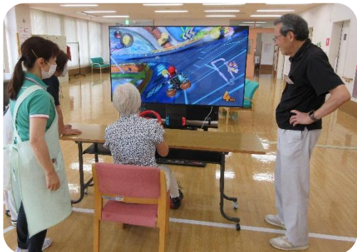
[e スポーツのマリオカートに挑戦]