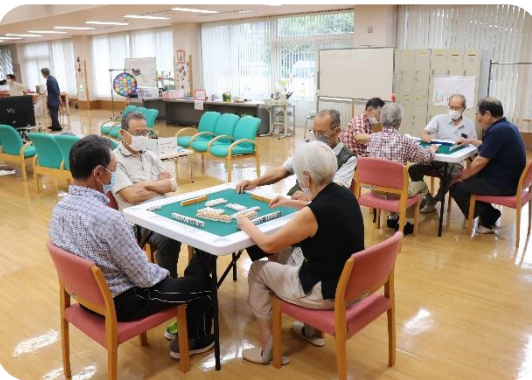
○ふれあいいきいきサロン 「サロンかだれ家」