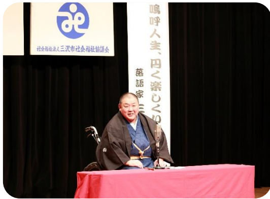
○第36回 三沢市民福祉大会

生活支援コーディネーターの毎月の情報交換や研修を行った他、有償型生活支援サービス「いきいき生活サポート事業」を実施しました。また、4年ぶりとなる地域きずな座談会は8つの地域で開催できました。