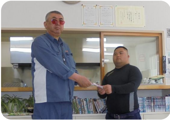
「青森銀行松友会様 (左)」