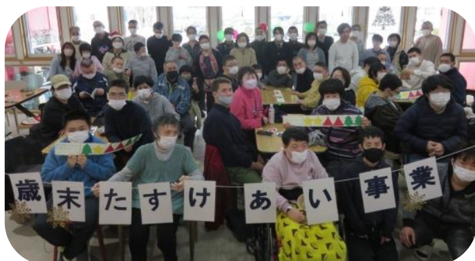
「ぴあ三沢利用者クリスマス会」

赤い羽根募金は2月20日現在で4,562,734円となっております。引き続きご協力をお願いします。詳しい使われ方や、各団体からの「ありがとうメッセージ」は、赤い羽根共同募金データベース「はねつと」でご覧いただけます。