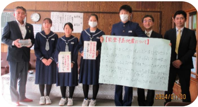
[堀口中学校3学年委員代表の皆さん]