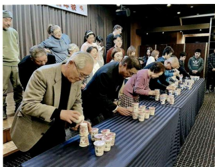
〔岡三沢七丁目町内会〕