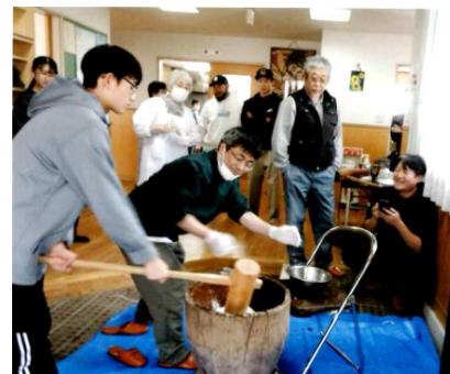
〔本町四丁目町内会〕