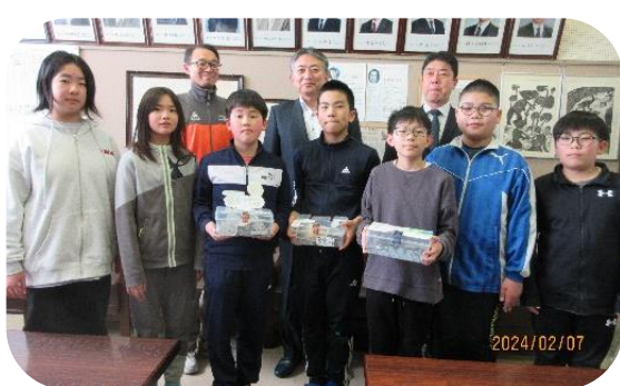
[三川目小学校5年生の皆さん]