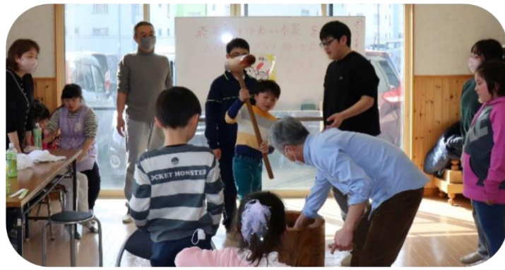
[ お助けマンクラブ「親子餅つき会」 ]

赤い羽根募金は2月25日現在4,548,337円となっております。引き続きご協力をお願いします。詳しい使われ方や、各団体からの「ありがとうメッセージ」は、赤い羽根共同募金データベース「はねっ」とご覧いただけます。