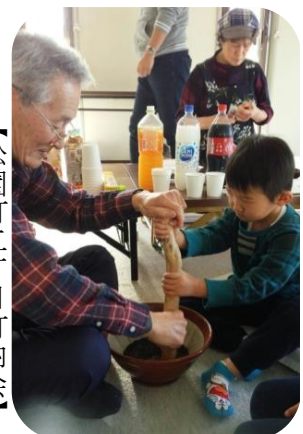
つき大会及び新年会