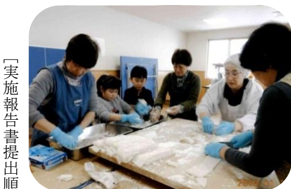
【実施報告書提出順】