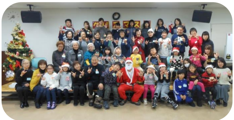
◎三沢手話サークルありんこ「ありんこクリスマス会」

赤い羽根募金は三沢市共同募金収納分で5,408,788円(2月20日現在)です。引き続き皆様のご協力をお願いします。 募金の詳しい使われ方や各団体からの「ありがとうメッセージ」は、赤い羽根共同募金データベース「はねつと」でご覧いただけます。