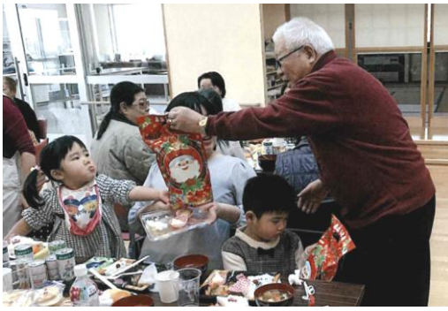
【桜町団地町内会：子どもたちへプレゼント】

●千代田町「交通安全講話及び餅つき大会」●ひばりヶ丘団地「餅つき・カラオケ大会」●桜町団地「忘年会&クリスマス会」