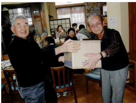
【駅前町内会：ビンゴゲーム表彰式】

●南町「新年お楽しみ交流会」●古間木二丁目「講演会及び新年会」●前平「町内会交流会」●自由ヶ丘「新年交流会」●美野原三丁目「高齢者との交流会」●西花園町「新年顔合わせ及び餅つき大会」●栄町「合同新年交流会」●日の出「世代間交流餅つき会」●三川目「町内会新年会」●駒沢「新年交流会」