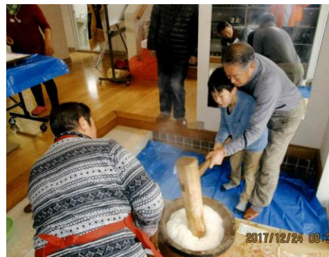
【堀口一丁目町内会：「よいしょっ!」「はいヨ!」】

●新町二・三・四丁目「新年合同交流会」●織笠「総会及び新年親睦会」●本町四丁目「新年餅つき大会及び大交流会」