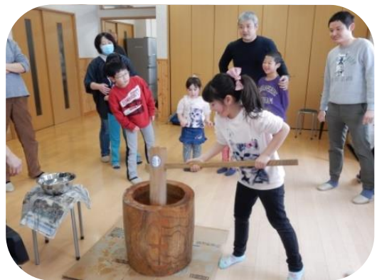
⑤三沢手話サークルありんこ 「ありんこクリスマス会」