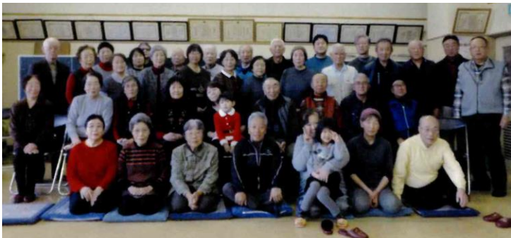
【東岡三沢町内会：参加者で集合写真】

●東町「交通安全講話・餅つき大会」●緑町「餅つき大会及び食事会」●鹿中「総会及び新年交流会」●東岡三沢「会員交流会」