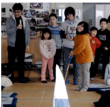
【本町四丁目町内会：みんなでゲーム】

●新町二・三・四丁目「新年合同交流会」●織笠「総会及び新年親睦会」●本町四丁目「新年餅つき大会及び大交流会」