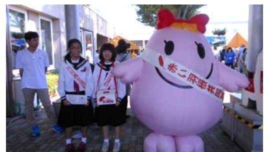
第三中学校の街頭募金 (昨年の社協まつり会場にて)