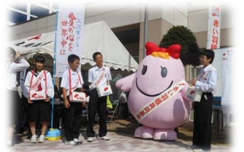
(昨年の社協まつりにて) 第二中・第三中学校の合同街頭募金