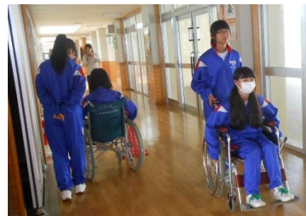
【三沢二中 車いす体験】