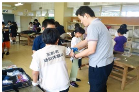
【木崎野小 高齢者疑似体験】