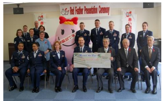
【昨年度の米軍共同募金贈呈式】

第三中学校・三沢市赤十字奉仕団・三沢市手をつなぐ育成会・三沢市身体障害者福祉会・さつき友の会・大三沢婦人会・看護ボランティア笑顔の会・三沢地区更生保護女性会