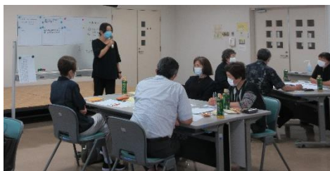
[ コーディネーター・ミーティング ]