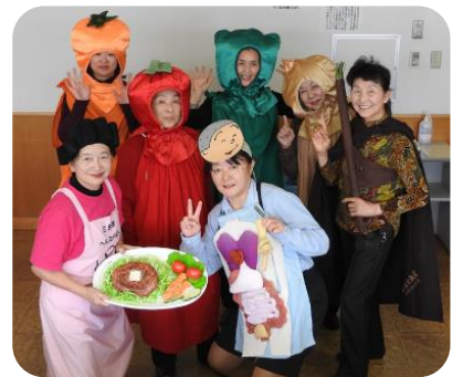
〔思い出の写真：県ボラフェスティバル〕

体、個人が展開する活動へと発展し実践されていること、また、相互の連絡調整や情報共有が容易な時代となったことから、県域の連絡協議会の存在意義や役割については一定の成果をあげたものと判断し解散に至りました。これまで担ってきた役割については県市民活動・ボランティアセンターや身近な郡市エリアの連絡協議会等に委ねられ、各地域のボランティア振興に取り組みされることとなります。三沢市ボラ連では、県ボラまつりや県ボラのつどいで寸劇を披露したり、出店したりしていました。解散は残念ではありますが、三沢市ボラ連は引き続き活動していきますので、皆様のご協力をお願いします。