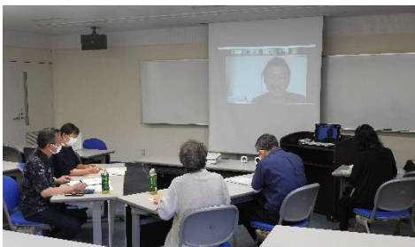
[ オンライン研修会の様子 ]