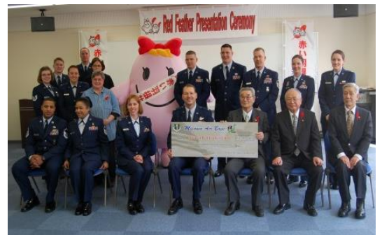
【昨年度の米軍共同募金贈呈式】

第三中学校・三沢市赤十字奉仕団・三沢市手をつなぐ育成会・三沢市身体障害者福祉会・さつき友の会・大三沢婦人会・看護ボランティア笑顔の会・三沢地区更生保護女性会