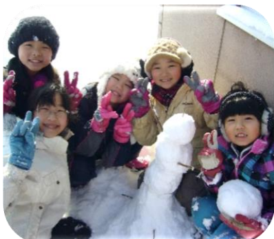
[みんなでスノーマン!]