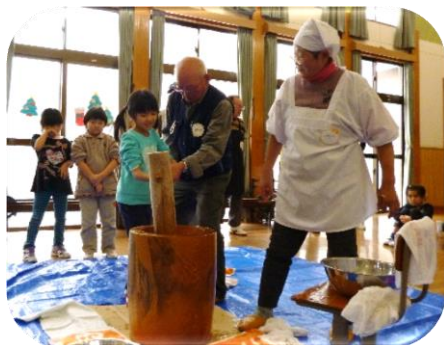
[せーの! よいっしょー! 餅つき会]