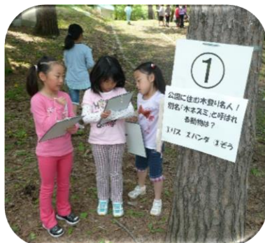
[自然保護隊のウォークラリー]