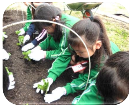
[おいしいブロッコリーになあれ♪]