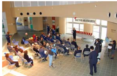
国際交流教育センターで行なわれた「米軍募金の贈呈式」

①赤い羽根共同募金への協力ありがとうございます 今年も沢山の皆様の善意を頂戴いたしました